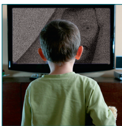
Gennland - Scopp / Shutterstock